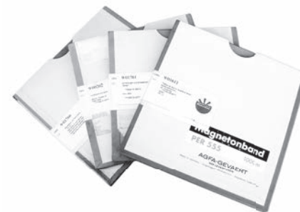
NA KORICAMA I STR. 10:

Originalna magnetofonska traka sa Adornovim predavanjem, iz arhive Österreichische Mediathek (na slici gore i sa ostalim sačuvanim predavanjima, navedenim u bibliografskoj napomeni).