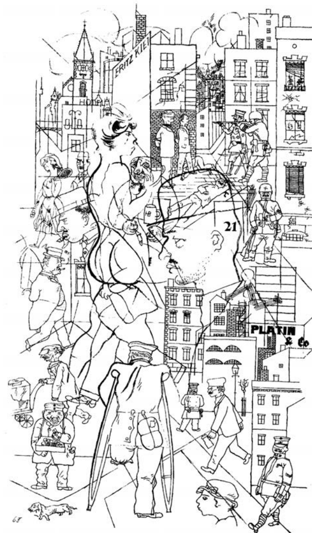
George Grosz, Querschnitt (Poprečni presek), 1922.