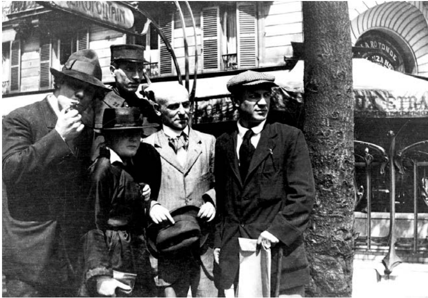
Manuel Ortiz de Zárate (slikar), Henri-Pierre Roché (autor romana Žil i Džim , u uniformi policajca), Marie Vassilieff (slikarka), Max Jacob (pesnik) i Pablo Picasso. Paris, Montparnasse, 1916.

samo podgrejana renesansa – izaziva osećanje sterilnosti čak i kod najbezazlenijih ljudi. To doprinosi legendi o dvadesetim kao vremenu u kojem je posrnulo carstvo duha i dalje polagalo pravo na stari značaj u životima ljudi. Činjenica da je posle 1918. kubizam izgubio privlačnost, svakako je simptom koji se može dijagnostikovati samo post mortem . Kanvajler prenosi: „Pikaso mi i danas često kaže kako je sve što je urađeno između 1907. i 1914. moglo nastati samo kroz zajednički rad. Biti izolovan, biti sam, mora da ga je strašno uznemiravalo, a upravo tada je to počelo da se menja.“ 10 Izolacija koja je uništavala kontinuitet slikarevog dela i koja nije samo njega primoravala na revizije, teško da je bila biografski nasumična sudbina. Došlo je do očigledne erozije kolektivnih energija koje su proizvele najveće inovacije u evropskoj umetnosti. Promena odnosa između