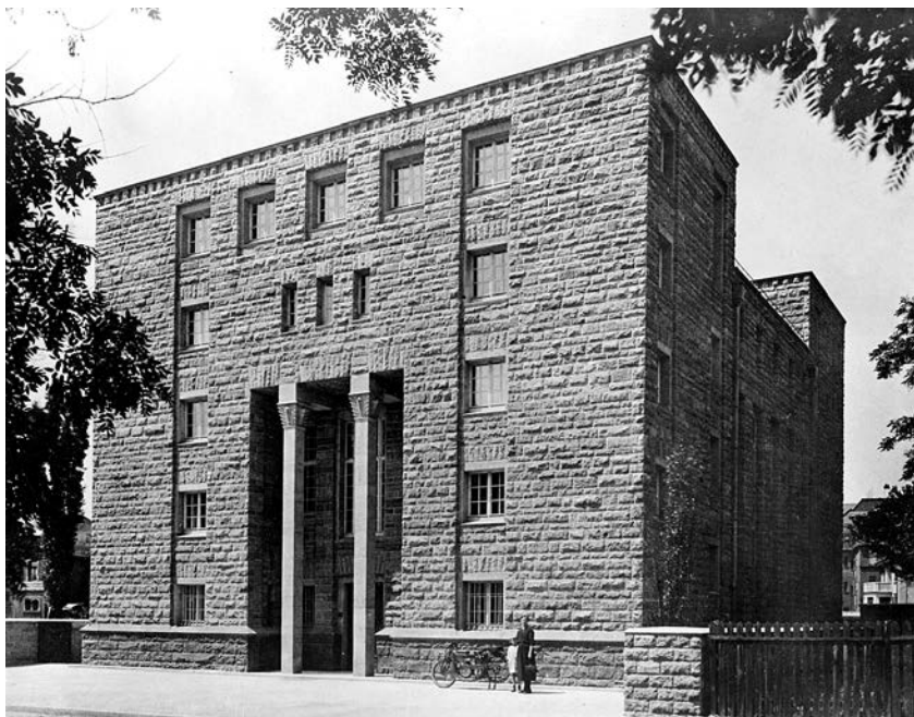
Prvo zdanje Instituta za sociološka istraživanja (Institut für Sozialforschung, od 1923) u Frankfurtu, delo arhitekta Franca Reklea (Franz Roedcke, 1924).