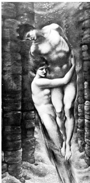
VILIJAM MORIS : UTOPIJA I ROMANSA