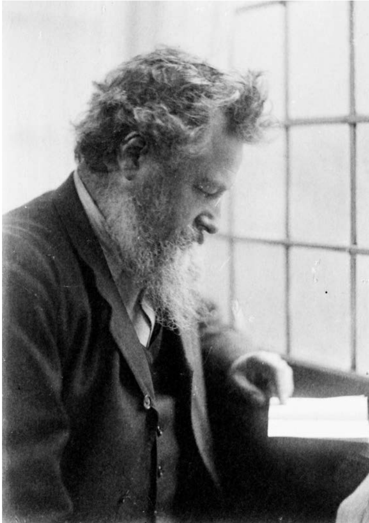
William Morris, na fotografiji Fredericka Hollyera, 1884.

kvantiteta. Ne smemo raditi zbog samog rada, da bismo stvarali vrednost i novac ili da bismo postigli najveću moguću masu „upotrebnih vrednosti“ već da bismo proizvodili lepe predmete tako što ćemo najveći mogući deo napora pretvoriti u uživanje, a onaj neizbežni napor svesti na obavezni minimum – čak i ako to znači oslanjanje na mašine, kada je to neophodno: