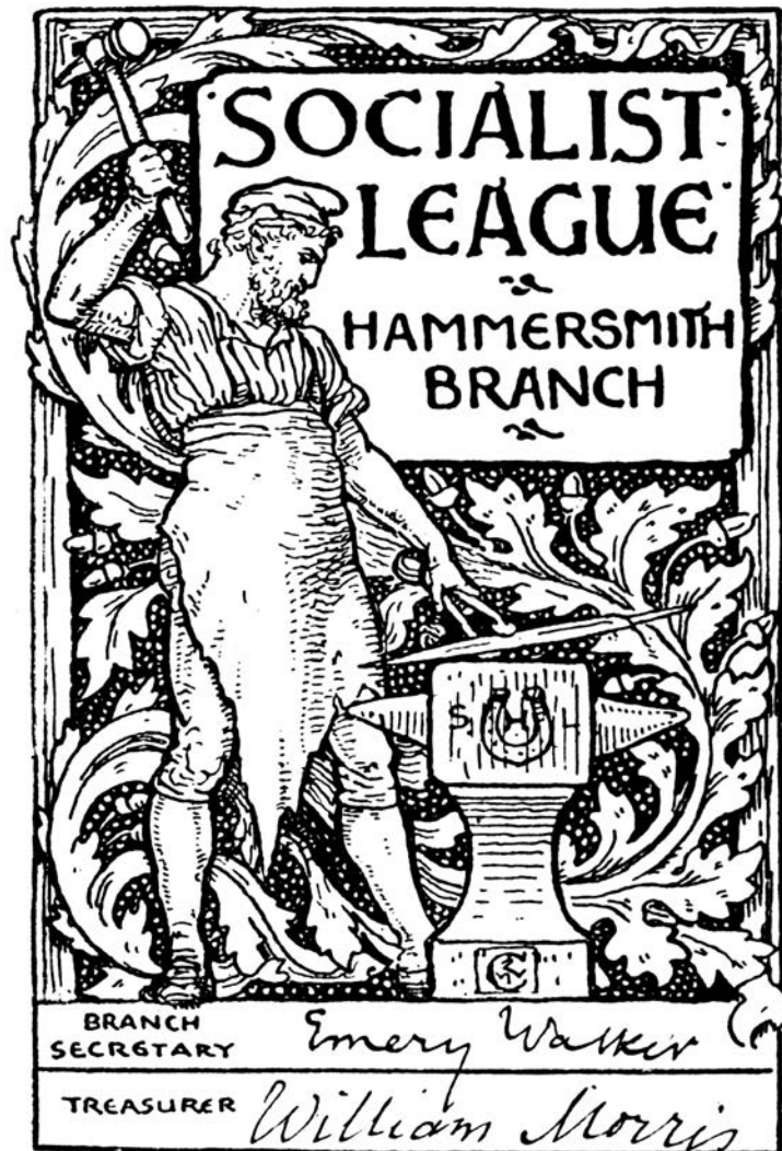
Socijalistička liga, Ogranak iz Hamersmita (London), Morisova članska karta, sa ilustracijom Voltera Krejna (Walter Crane), 1885.