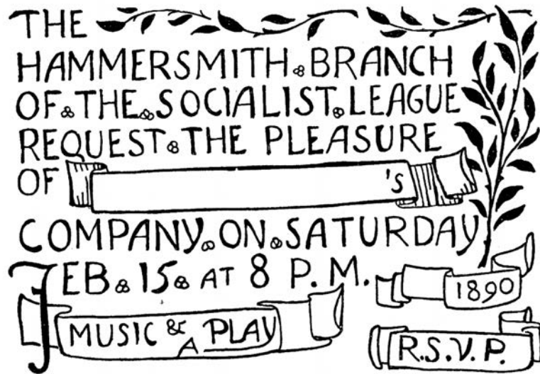
Pozivnica za umetničko i zabavno veče u prostorijama Socijalističke lige iz Hamersmita, 15. II 1890.

Vilijam Moris je rođen 1834, u blizini Londona (Walthamstow, danas deo Londona), u imućnoj porodici. Odrastao je u ruralnom okruženju, koje je i dalje zadržavalo elemente samodovoljnosti i kojeg se kasnije sigurno uvek sećao s nostalgijom. Kao mladić, upoznao je umetnike povezane s preraphaelizmom (Pre-Raphaelite Brotherhood ili Pre-Raphaelites) i počeo da objavljuje poeme u kojima je slavio srednji vek. Pod uticajem Džona Raskina (John Ruskin) uočio je opadanje zanata i umetnosti svog vremena i osnovao vlastitu firmu za dekoraciju i primenjenu umetnost, koja je postigla značajan uspeh. Burnog temperamenta, započeo je karijeru polemičara i predavača tako što je protestovao zbog restauracije srednjovekovnih zdanja, koju je smatrao katastrofalnom. U tom cilju osnovao je Društvo za zaštitu drevnih zdanja (Society for the Protection of Ancient Buildings, 1877). Tek oko 1880. otkrio je socijalizam, u njegovoj marksističkoj verziji, i počeo da se uključuje u rad različitih radikalnih organizacija, ponekad bliskih anarhizmu. Postao je neumorni agitator socijalizma, a često je držao govore i na ulici, gde ga je ponekad hapsila policija. Brošure su prenosile njegove