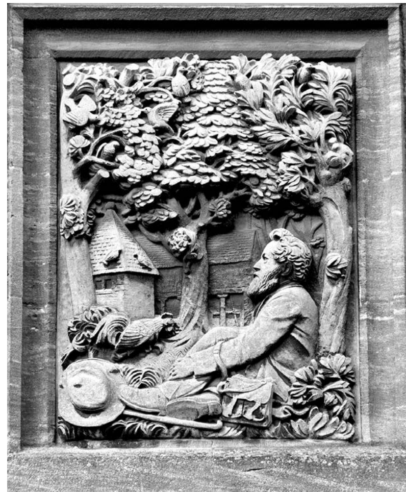
„Moris u svom gaju (Morris in the Home Mead)“, reljef Džordža Džeka (George Jack), prema crtežu Filipa Veba (Philip Webb), na zidu William Morris Memorial Cottage u Kelmskottu (1902).