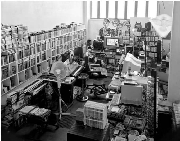
Studio Krisa Markera, Rue Courat br. 3, Pariz.

porażeni kandidati, dostojanstveni i razočarani, odnose svog jednookog Darumu. 6