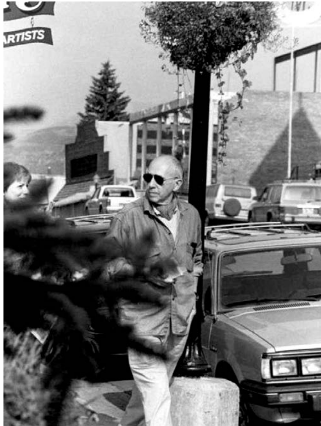
Kris Marker, za vreme Filmskog Festivala u Telurajdu, 1987 (Telluride Film Festival, Kolorado).

primećeni, ali izgledaju kao da ne primećuju da su primećeni. Oni žive u paralelnom vremenu, nevidljivi akvarijumski zid razdvaja ih od gomile koju privlače, a ja mogu da provedem celo popodne razmišljajući o maloj takenoko, koja očigledno po prvi put uči običaje svoje planete.