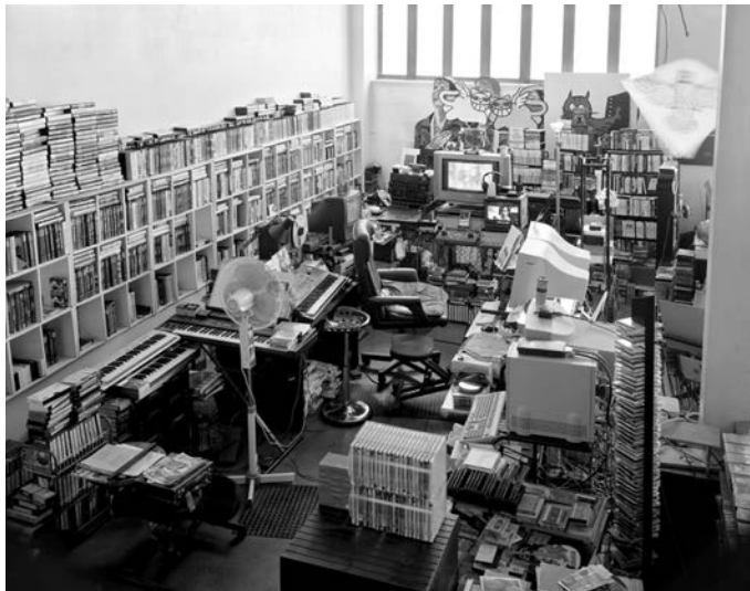
Studio Krisa Markera, Rue Courat br. 3, Pariz.

Kris Marker. Jedna od izuzetnih stvari u vezi sa Sans Soleil jeste to što smo ga uradili s četiri različita glasa, na francuskom, nemačkom, engleskom i japanskom, pri čemu smo na svakom jeziku pronašli skoro isti glas. Folker Šlendorf (Volker Schlöndorff), koji je za to bio zadužen u UFA (Universum Film AG), pronašao je nemački glas (glumica i rediteljka, Charlotte Kerr), ali najzanimljivija priča bila je ona s japanskim glasom. U Tokiju sam često gledao jednu televizijsku emisiju. Išla je na Fudžijevom kanalu, izjutra, neka vrsta ispovedne ženske emisije, sa igrama i često s plakanjem; zato što Japanci mnogo plaću na televiziji i vole da gledaju žene koje plaću na televiziji (u stvari, svakog, to ih stvarno zabavlja).