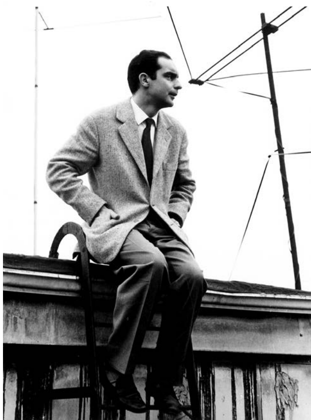
Italo Kalvino u Njujorku, 1959–1960.