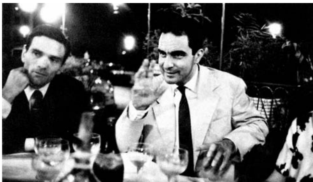
Pazolini i Kalvino u kafeu Rosati , na Piazza del Popolo, u Rimu, 1960.

je uzvikujem na sve strane, kao očerupana kokoš, tako da i dalje trpim ne samo ocrnjivanje (za koje se ispostavilo da je bilo potpuno nezaslužno) već i nenaklonost onih koji mi ne mogu oprostiti što sam tada rekao ono što je bilo ispravno reći. Kao što sam rekao, nekoliko godina o Kalvinu nisam čuo praktično ništa, kao da je bio i fizički suspendovan. Kosmikomike sam ( Le cosmicomiche , 1965), priznajem, dočekao kao nešto nestvarno i privremeno. A sada se opet pojavio, ne samo stvaran već stvarniji nego ikad, sa svojom poslednjom knjigom, koja je ne samo njegova najlepša knjiga već i apsolutno lepa.