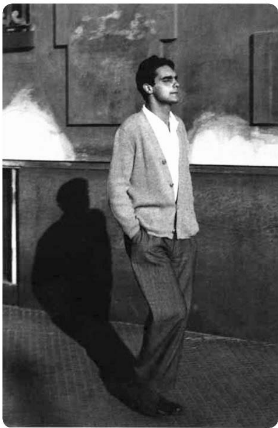
Italo Kalvino, Torino, oko 1950.