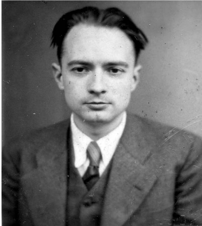
Jacques Ellul (1912–1994), Bordo, 1944.