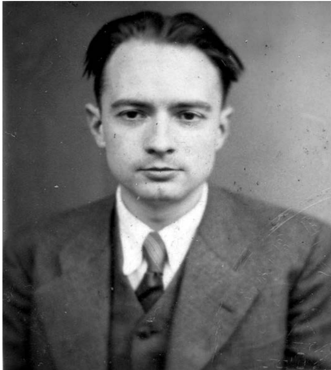
Jacques Ellul (1912–1994), Bordo, 1944.