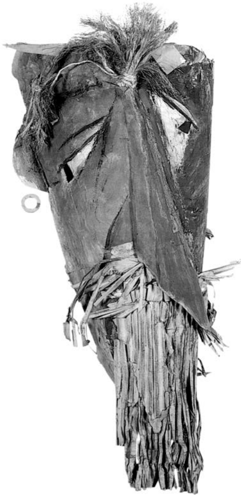
M. Janco, maska, „g. Firdusi“, iz predstave Sfinga i strašilo (Sphinx und Strohmännchen), Oskar Kokoška, Galerie Dada, 14. IV 1917.