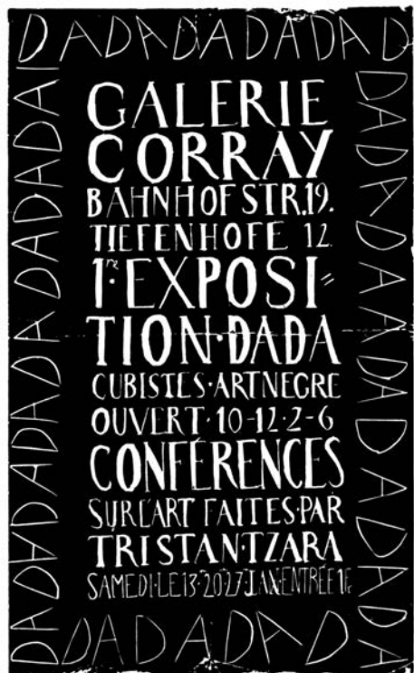
Plakat, M. Janco, 1917.

Upravo u tom trenutku, Bal se vratio na scenu i spasio dadu, tako što je otvorio Galeriju Dada (Galerie Dada, prethodno Galerie Corray), u samom centru grada. Dadaisti su se izmirili između sebe i ponovo okupili, organizovali izložbe i zajedničke centre; ovog puta je tu bio i velikodušni doprinos najvećih stranih umetnika, koji nisu ak-