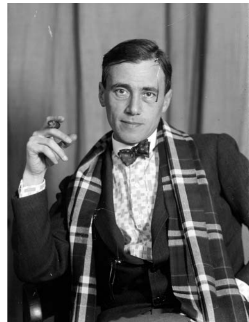
Hans Richter

Na jednoj od tih priredbi, prišao nam je neki simpatični mladić i predstavio se: „Rihter, Berlin.“ (Hans Richter) Izgledao je kao neki veliki biznismen ili sin milionera, ali ubrzo smo ga pročitani. Dao je svoj doprinos najnovijim dadaističkim publikacijama, ali je već osećao želju da učestvuje i