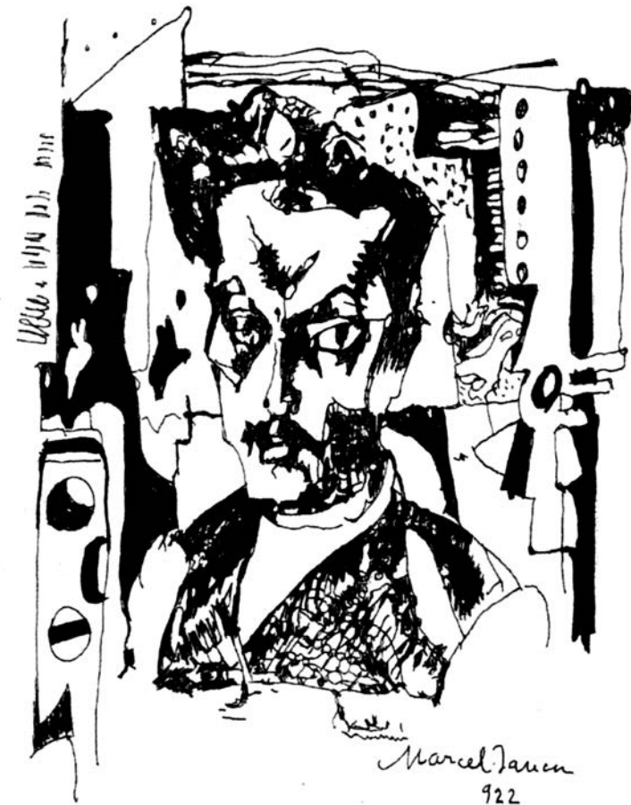
MARSEL JANKO Kreativna dada (1957) Dada u dve brzine (1966)