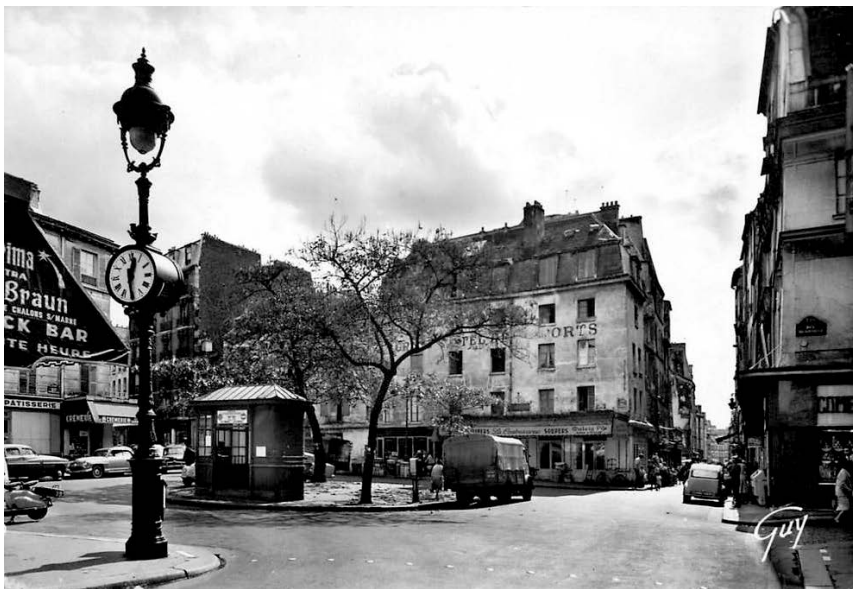
Trg Kontreskarp, oko 1950.

Na razglednici, u donjem desnom uglu, zaista piše „Guy“.