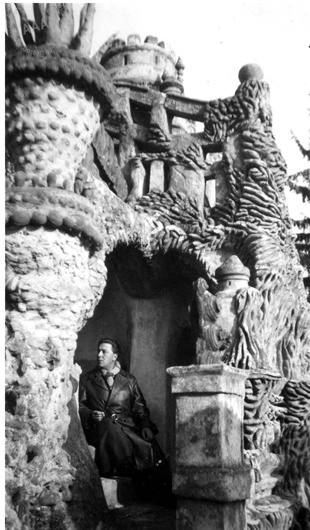
Andre Breton, u „Palais idéal“ Ferdinana „Poštara“ Ševala, 1931. Les Vases communicants , izdanje iz 1955.