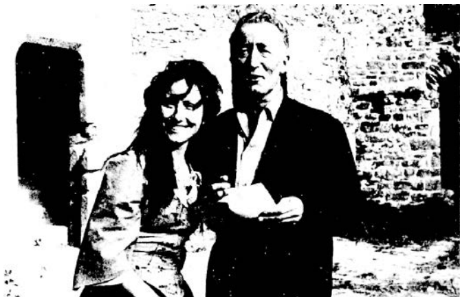
ZA KLODA (Claude Roy, 1915–1997) i LOLE (Loleh Bellon, 1925–1999)