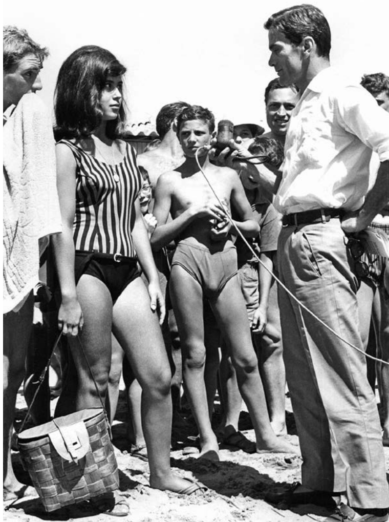
Comizi d'amore (Ljubavni susreti, 1964)