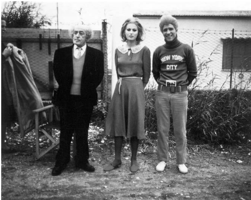
Toto, Silvana Mangano i Nineto Davoli, u filmu La Terra vista dalla Luna (omnibus Le streghe , 1967)

Na prvoj strani l'Unità , od 2. juna, čitamo veliki naslov: „Živela anti-fašistička republika.“