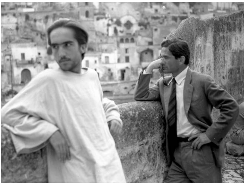
Pazolini i Enrike Irazoki (Enrique Irazoqui, 1944), u mestu Sassi di Matera (južna Italija), na snimanju filma Il Vangelo secondo Matteo , 1964.

„Razlika između adjektivnog i supstantivnog fašizma seže sve do časopisa Il Politecnico , drugim rečima, u vreme neposredno posle rata...“ Tako počinje članak o fašizmu Franka Fortinija ( L'Europeo , 26. XII 1974), članak s kojim se u načelu, kako se to kaže, potpuno i u celini slažem. 36 Ne mogu, međutim, da se složim s njegovim tendencioznim početkom. U stvari, razlika između dva „fašizma“, koju je artikulisao Politecnico , nije ni relevantna, niti aktuelna. Važila je do pre nekih deset godina, kada je demohrišćanska vlast još uvek bila čist i prost prođuzetak fašističkog režima.