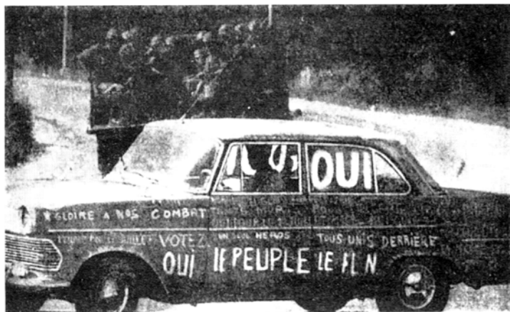
L'Algérie et l'écriture.

« L'écriture est précisément ce compromis entre une liberté et un souvenir, elle est cette liberté souvenante qui n'est liberté que dans le geste du choix, mais déjà plus dans sa durée. Je puis sans doute aujourd'hui me choisir telle ou telle écriture, et dans ce geste affirmer ma liberté, prétendre à une fraîcheur ou à une tradition ; je ne puis déjà plus la développer dans une durée sans devenir peu à peu prisonnier des mots d'autrui et même de mes propres mots. »