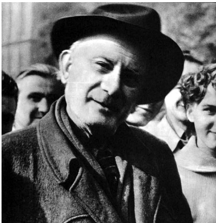
Tin Ujević (1891–1955)