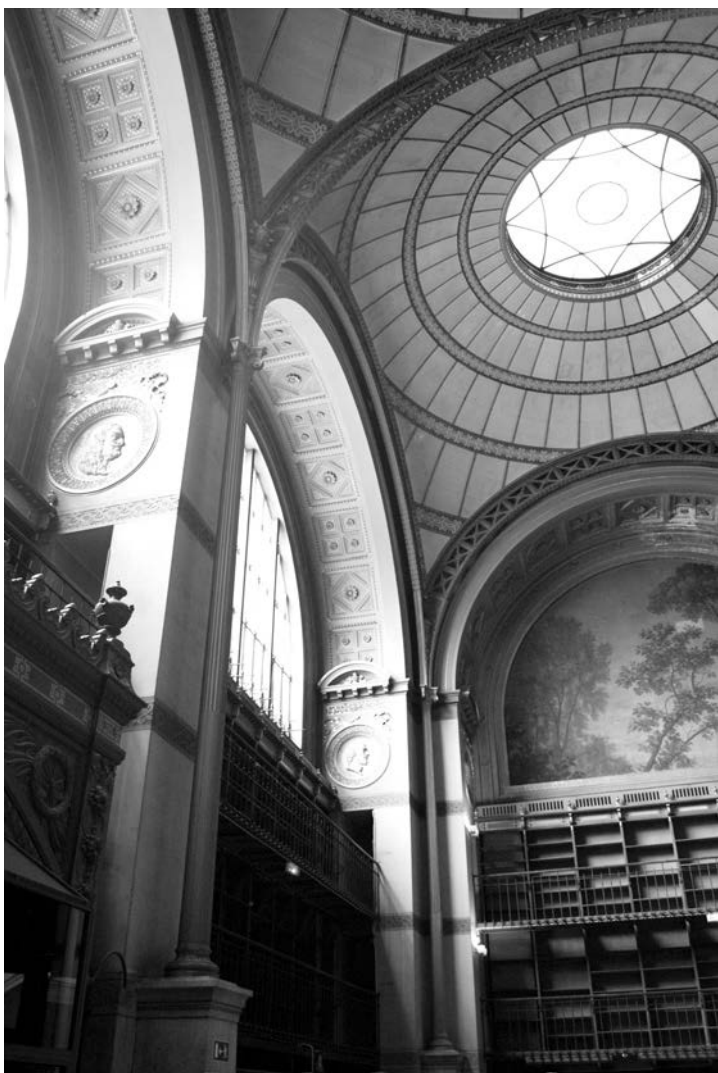
BnF, Salle Labrouste