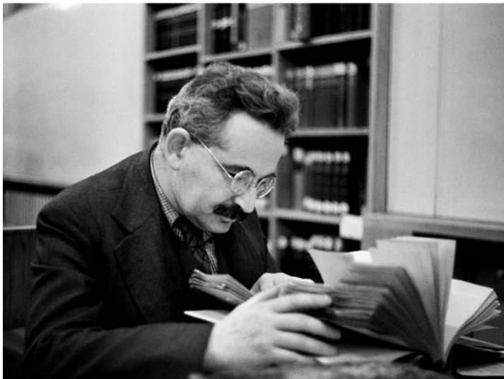
Gisèle Freund: Walter Benjamin, u nekom od kabineta Bibliothèque Nationale de France (BnF), u Parizu, 1937.

Snješka Knežević (bolji prevod u odnosu na ostale pokušaje, ali, zbog razumljivih ograničenja tog izdanja, bez fotografija i još nekih podataka koji se mogu naći u Benjaminovim Sabranim delima , tom 2, „Kleine Geschichte der Photographie“, 1931, str. 368–385).