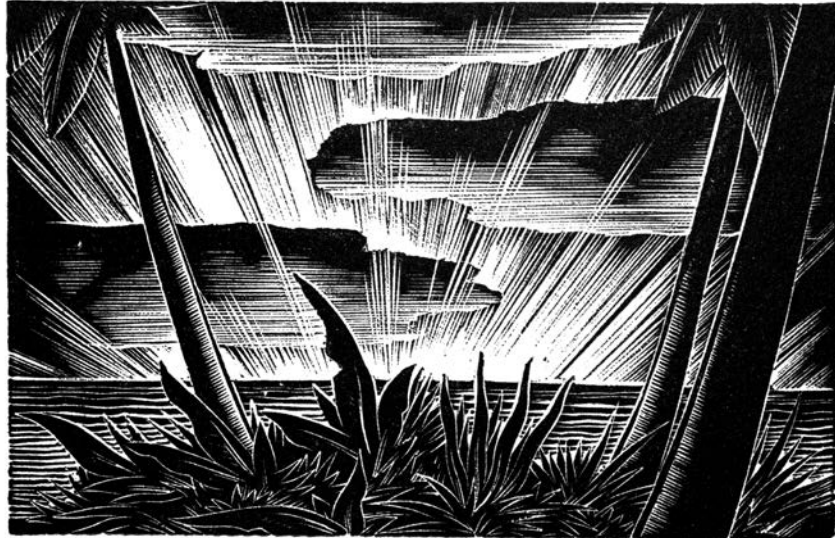
Lynd Ward, duborez za knjigu Hot Countries (Alec Waugh, 1930, str. 1)