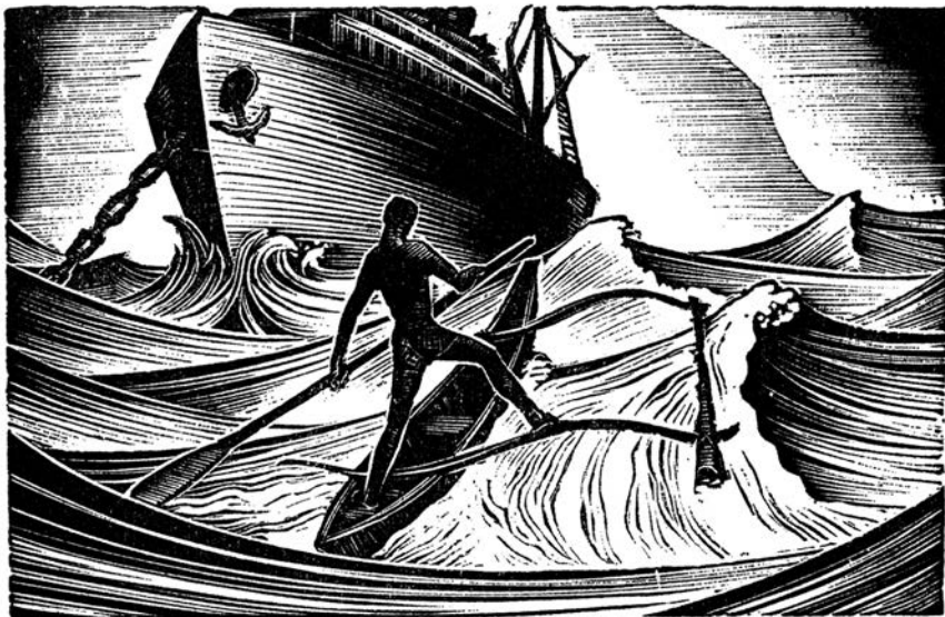
Lynd Ward, Hot Countries (Alec Waugh, 1930, str. 127)

U međuvremenu, topovima naoružani jedrenjaci „najavili su suštinski uspon Evrope u svetu“, kada je reč o kontroli okeanskih trgovačkih puteva. 35 Krajem XV veka, Portugalija i Španija, prve globalne pomorske sile, nadmetale su se oko širokih poteza Atlantskog, Indijskog i Tihog okeana. Zajedničko svetsko dobro mora bilo je prilično naglo, već na samom početku moderne istorijske epohe, lišeno čari i instrumentalizovano. Njegova relativna izolovanost, tišina, duhovno bogatstvo i intimnost ustuknuli su pred prvim naletom globalizacije, a zatim i industrijske revolucije.