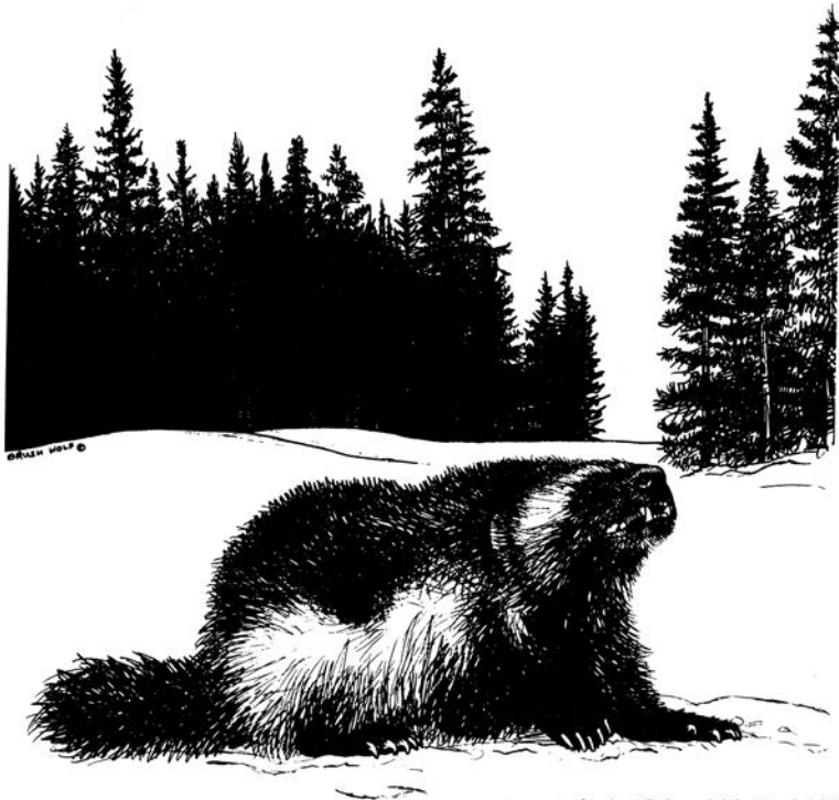
wolverine (Gulo gulo)