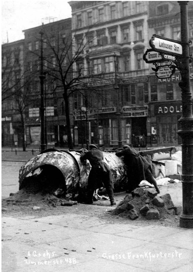
Spartakovci na barikadama, Berlin, 1918–1919.