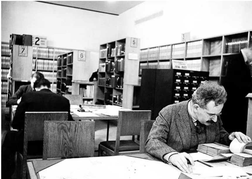
Walter Benjamin, Bibliothèque Nationale, Paris, 1937.