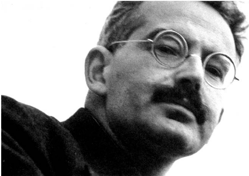
Walter Benjamin, foto Gisèle Freund, Paris, 1937.

što obično nazivamo filozofijom. Adorno je još 1955. 3 ponudio snažnu korekciju tog utiska: pokazao je da je svaki komad Benjaminovog kulturološkog kriticizma bio u isti mah „filozofija svog predmeta“. Počevši od 1924, Benjamin je analizirao širok spektar kulturnih predmeta, bez kvalitativne podele na visoko i nisko, i obično za temu uzimao „nase“ istorije, to jest, zapostavljene i neupadljive ostatke iščezlih miljea i zaboravljenih događaja. Bio je usredsređen na marginalno, na anegdodu i tajnu istoriju. S druge strane, nikada se nije odrekao standarda veličine. Prvi trag u evropskoj književnosti ostavio je sa esejom o Geteu, da bi se kasnije redovno osvrtao na neke istaknute savremenike, kao što su Prust, Kafka, Breht i Valeri, i svoje raznovrsne studije Pariza iz sredine XIX veka fokusirao na Bodlerova epohalna ostvarenja. Takvi reprezentativni umetnici bili su zvezde vodilje njegove mikrološkičke kultureloške analize. Naime, njegovu misao je usmeravao osećaj za celinu, koja se otkriva samo kroz uranjanje u gravitaciono polje nekog rečitog detalja, kroz opažanje koje je u istoj meri individualizujuće i alegorijsko.