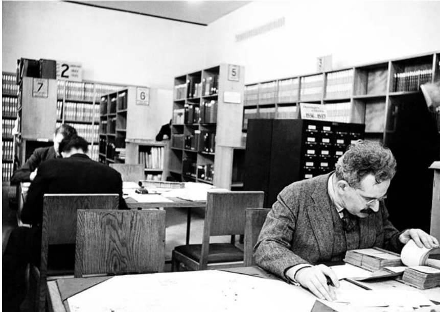
Walter Benjamin, Bibliothèque Nationale, foto Gisèle Freund, Paris, 1937.