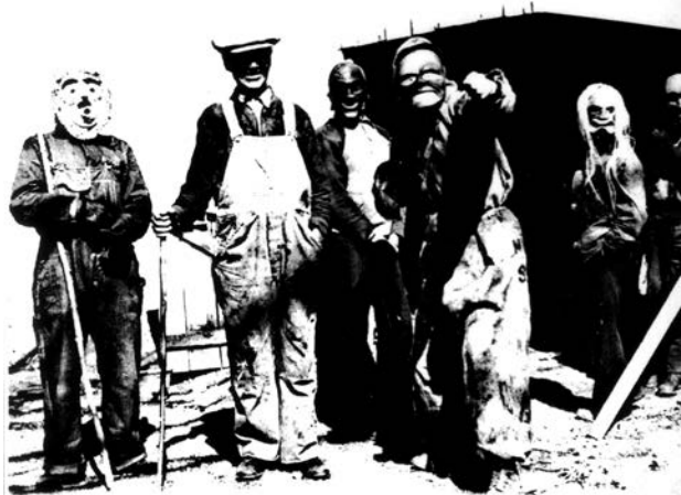
anarhija/ blok 45

Prvo izdanje, Porodična biblioteka br. 5, decembar 2003. Na koricama: Seneka Indijanci („Irokezi“), za vreme prolećnog obreda pročišćenja; rezervat Allegany, Coldspring, New York, 12. april 1942. „Oni koji su nekada imali malo i bili sve, sada imaju mnogo, ali su ništa.“ (F. Perlman, Reprodukcija , 1969)