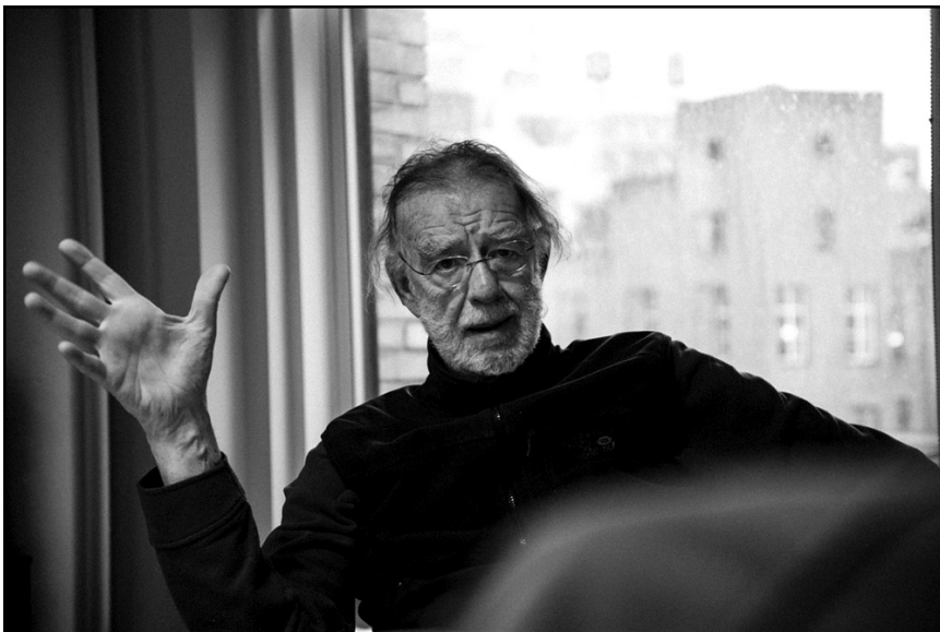
G. Reggio, New York, januar 2014.

da najviše možemo napraviti kroz pružanje primjera, ne samo riječima, već služeći se onim riječima iza kojih možemo stati s onim što radimo. Živjeti u svijetu, ali ne biti dio tog svijeta, biti odmetnik, ali znati da smo svi unutra. Živjeti sa zagonetkom da život nije ovo ili ono, nego da je život i ovo i ono. Da nije crn ili bijel, već da je i crn i bijel. Tom bih receptu dodao i malo humora i eto kako bi se pojedinac mogao naći u prilici živjeti smislenim životom.