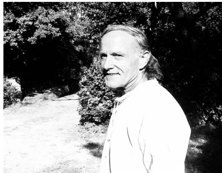
Jacques Camatte/ Revue Invariance . http://revueinvariance.pagesperso-orange.fr

Arhiva Revue Invariance (skenirana originalna izdanja, do 1980): http://archivesautonomies.org/spip.php?rubrique509