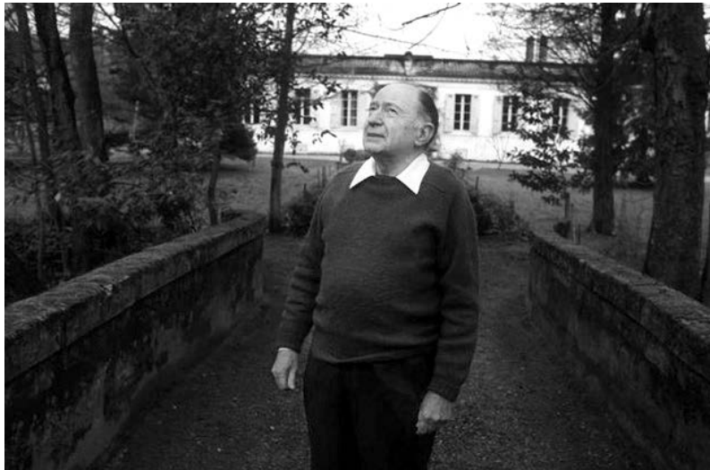
Jacques Ellul (1912–1994)

Jedva da znam za neki biblijski tekst koji rad predstavlja kao nešto dragoceno, dobro ili čestito. To se mora jasno reći. Rad je u Bibliji nužnost, prinuda, kazna, osim u svega nekoliko netipičnih tekstova. Naravno, svakome je poznata priča iz Knjige postanja (2:15), 1 u kojem se čovečanstvo, pre raskida s Bogom, poziva da obrađuje zemlju i čuva Rajski vrt. Tako smo dobili celu armiju teologa koji u tom tekstu vide izvor rada i koji na osnovu njega tvrde kako raspolažu dokazom da je rad deo ljudske „prirode“. Ono na šta bih hteo da ukažem, međutim, jeste paradoks da prema tom izvornom shvatanju rad nema nijednu od tih karakteristika! Istina, nalaže se obrađivanje zemlje, ali od toga ima malo koristi, zato što Vrt već cveta, sam od sebe, bez neke naročite ljudske pomoći. Pored toga, Vrt treba i „čuvati“; ali, od koga? Nećemo ulaziti u raspravu o preegzistenciji zla u stvaranju; od takvog zla, u Bibliji ne vidim ni traga. Tu nema neprijatelja, nema „načela zla“, nema Sotone. Tu je samo jedna zmija, ne neka mitska ili metafizička zmija, već prosto zmija, životinja. Ipak, Adamu je rečeno da obrađuje zemlju i da je čuva, da se bavi savršeno beskorisnim i nepotrebnim poslovima. To nije ni zakon, ni prinuda, niti nužnost. U isto vreme, razlika između takvih aktivnosti i igre još uvek ne postoji. Ne možemo govoriti o radu , u uobičajenom smislu.