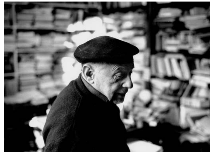
The Betrayal by Technology: A Portrait of Jacques Ellul (Het Verraad Van De Techniek)