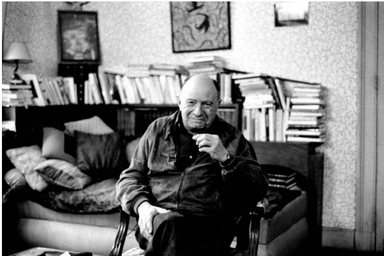
Žak Elil, u svojoj kući u Pesaku (Pessac), nadomak Bordo, za vreme snimanja dokumentarca Tehnička obmana , 1990 (1992).