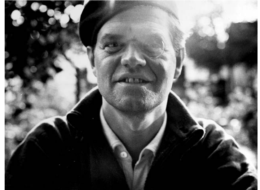
Raoul Hausmann Beč, 12. VII 1887. – Limož, 1. II 1972.