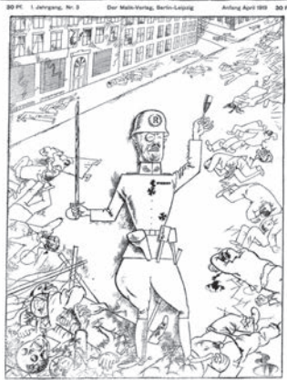
Nazdravlje, Noske! Proletarijat je sada razoružan. (Crtež: Gros, 1919.)