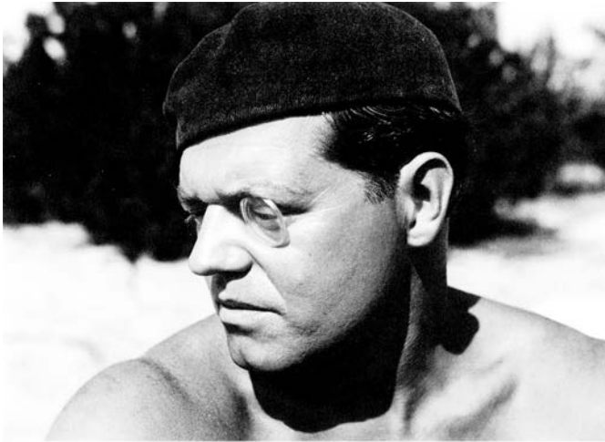
Raoul Hausmann, 1930.