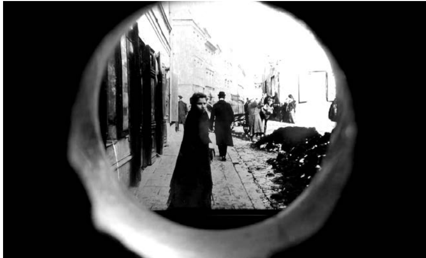
Stereoskopska fotografija iz varšavskog „Fotoplastikona“ (1905?).