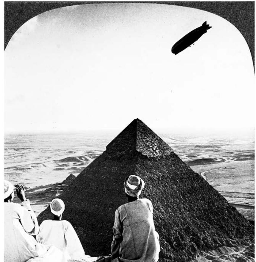
Einbahnstraße, 1928, S. 18–26.

ZAJEDNIČKA ARHIVA http://anarhisticka-biblioteka.net