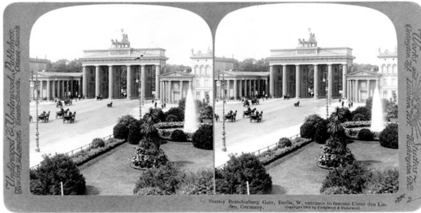
Natpis sa stereoskopske fotografije: „Veličanstvena Brandenburška kapija, zapadni ulaz u čuveni bulevar Unter den Linden (Berlin), Nemačka.“ Underwood & Underwood, New York, c. 1903.