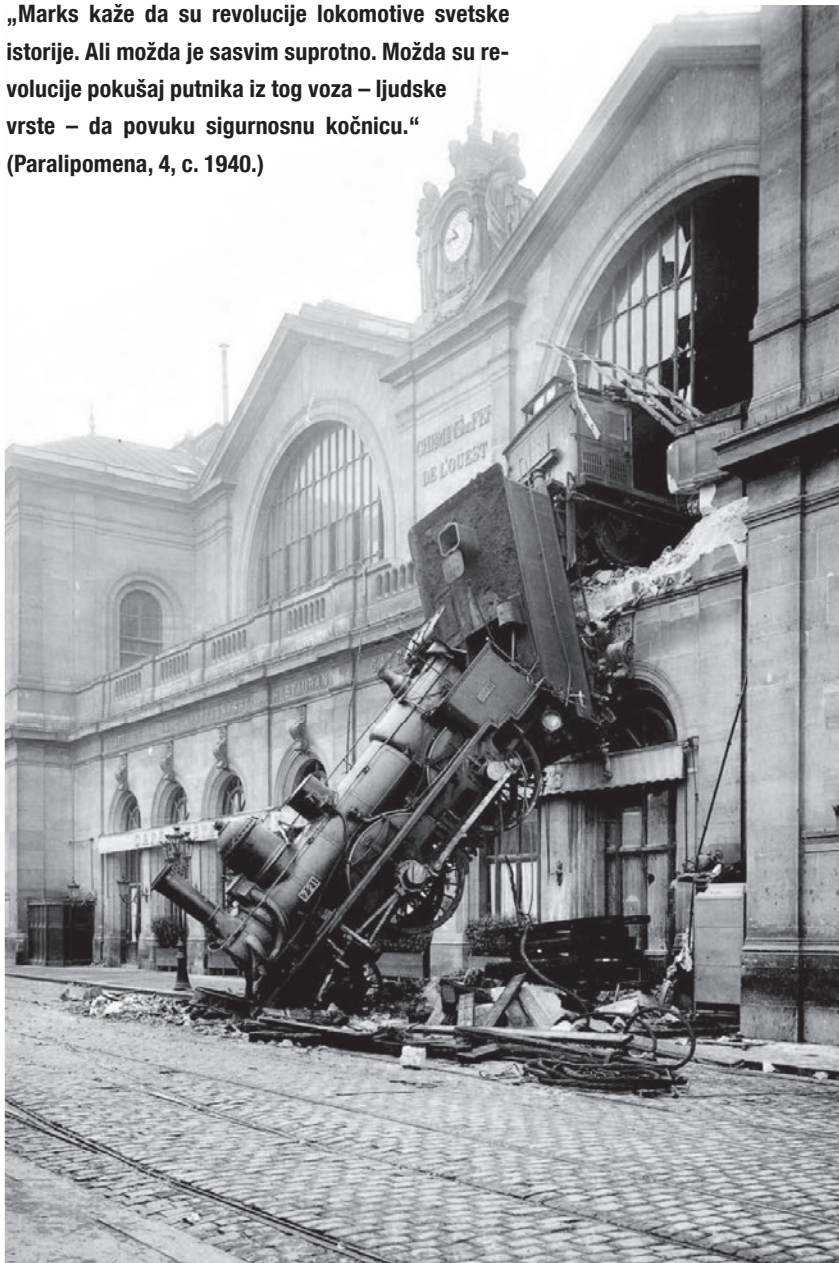
Gare Montparnasse, Paris, 22. X 1895.

„Marks kaže da su revolucije lokomotive svetske istorije. Ali možda je sasvim suprotno. Možda su revolucije pokušaj putnika iz tog voza – ljudske vrste – da povuku sigurnosnu kočnicu.“ (Paralipomena, 4, c. 1940.)