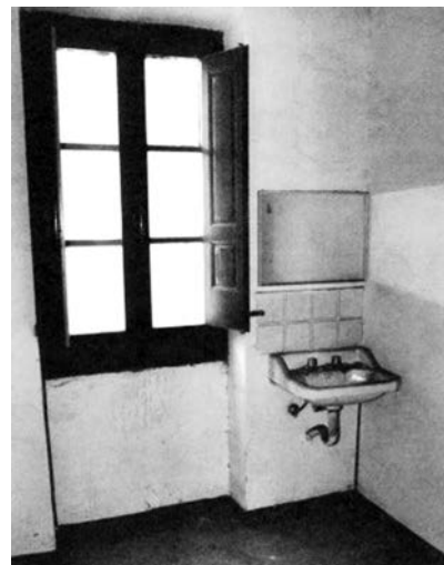
Hotel de Francia, soba br. 4, Benjaminovo poslednje boravište.

kojom je prešao Pirineje, ali koja je posle njegove smrti nestala), jednu je poslao Gretel Adorno u Njujork (april-maj 1940), a jednu poverio Hani Arent (koju je upoznao 1929, dok je bila u braku s njegovim bliskim rođakom Güntherom Andersom Sternom); ona je, po dolasku u Njujork, rukopis predala Teodoru Adornu (u međuvremenu je napravila i jednu kopiju koju je zadržala za sebe; Adorno je već imao nešto drugačiju verziju upućenu Gretel). Adorno i Horkhajmer su zatim priredili prvo mimeografsko izdanje ovih